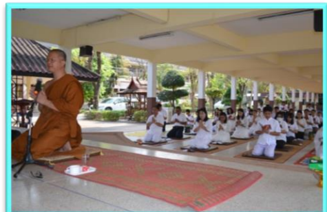
สวดมนต์ให้พระสร้างกุศลกรรม

ถ้าจำแนกตามทางที่ทำความหรือตามการแสดงออก มี 3 ประเภท คือ กายกรรม การกระทำทางกาย วจีกรรม การกระทำทางวาจา และ มโนกรรม การกระทำทางใจ