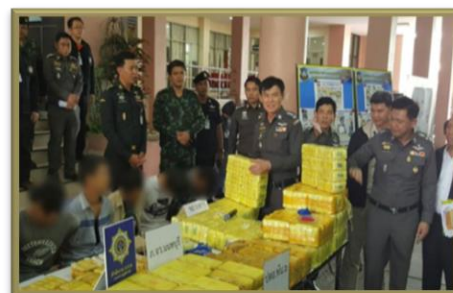
ภาพ : การจับกุมผู้ค้ายาเสพติด เป็นกรรมที่ให้ผลในปัจจุบัน

1. ทิฏฐธรรมเวทนิยกรรม หมายถึง กรรมที่ให้ผลในปัจจุบัน หรือในชาตินี้ เป็นกรรมที่มีพลังแก่กล้ามากจึงให้ผลในปัจจุบัน ฝ่ายกุศล ได้แก่ ศีล ทาน ที่ได้บำเพ็ญอยู่เสมอ หรือกระทำกุศลอย่างแรงกล้า เช่น ยินดีเสียสละความสุขหรือแม้แต่ชีวิตของตน เพื่อรักษาศีล ให้บริสุทธิ์ จะได้รับผลจากการกระทำในชาตินี้ ตัวอย่างเช่น ปุณณทาสชายเข็ญใจ ยินดีเสียสละ โดยนำเอาอาหารที่ภรรยาตั้งใจนำมาให้ตนรับประทานนั้น น้อมถวายแด่พระสารีบุตรพระอรหันต์เจ้า เมื่อคราวที่ท่านออกจากนิโรธสมาบัติมาใหม่ ๆ ท่านนั้นได้อำนวยผลให้ ปุณณทาสผู้เข็ญใจ กลับกลายเป็นมหาเศรษฐี ภายในเวลาไม่นานนัก และฝ่ายอกุศล อันได้แก่ อกุศลหนักเช่น ประทุษร้ายบิดามารดา หรือผู้มีศีลบริสุทธิ์ ตลอดจนความชั่วที่กระทำอยู่เสมอ เช่น ค้ายาเสพติด ย่อมถูกจับและถูกประหารชีวิต ในที่สุด เป็นต้น