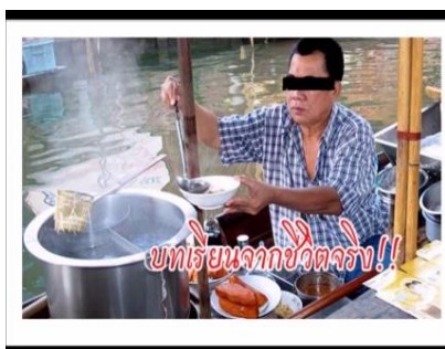
ภาพ : จากเศรษฐีเงินล้าน บั้นปลาย ไม่เหลืออะไร ต้องมาขายก๋วยเตี๋ยว

6. อุปัตถัมภกรรม หมายถึง กรรมสนับสนุน หรือกรรมอุปถัมภ์ เป็นกรรมที่คอยสนับสนุนขนกกรรม เช่น เกิดมาในตระกูลยากจน แต่กระทำความดีช่วยเหลือผู้อื่นอยู่ไม่ขาด อาจได้รับความเวทนาสงสารจากบุคคลอื่น ให้ได้รับการศึกษา ได้มีงานทำ มีหน้าที่การงานก้าวหน้า จนสามารถยกฐานะของตนเองดีขึ้น เป็นต้น