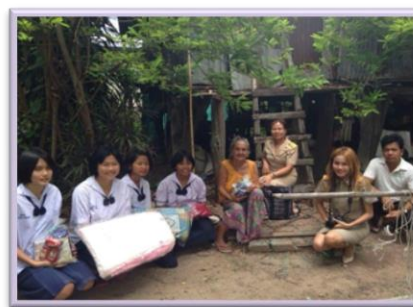
ภาพ : เยี่ยมคนชราที่อยู่ลำพัง มอบสิ่งของเครื่องใช้ที่จำเป็น

หมายถึง กรรมสะสม ได้แก่กรรมดีหรือกรรมชั่วที่ประทุพติมาก ๆ หรือทำบ่อย ๆ สั่งสมไปเรื่อย ๆ กรรมไหนสะสมบ่อยและมาก ๆ ก็จะให้ผลกรรมเช่นนั้น