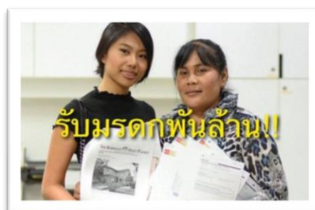
ภาพ : สองแม่ลูกหลังจากที่ลำบากมานาน ได้รับข่าวดี สามีต่างชาติเสียชีวิตทิ้งมรดกไว้ให้

8. อุปฆาตกรรม หมายถึง กรรมตัดรอน เป็นกรรมที่มีอำนาจมากเป็นพิเศษ จะให้ผลอย่างรุนแรงในทันที สามารถจัดหรือทำลายกรรมที่ให้ผลอยู่ก่อนแล้วให้พ่ายแพ้หมดอำนาจลงได้ จากนั้นกรรมตัดรอนก็จะเข้ามาให้ผลแทนต่อไป เช่น เกิดมาเป็นมหาเศรษฐี มีความสุขสบาย อยู่ได้ไม่นานก็ถูกฆ่าตาย จัดเป็นกรรมตัดรอนฝ่ายชั่ว หรือเกิดมายากจน แต่ได้รับลาภใหญ่กลายเป็นเศรษฐีถือเป็นกรรมตัดรอนฝ่ายดี เป็นต้น